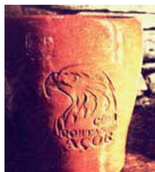
Copo em barro foi concebido para o evento

Artesanato, produtos em madeira, agrícolas, entre muitos outros, são algumas das “mercadorias” que poderá encontrar no certame, assim como muitas iguarias relacionadas com a época, não faltando, naturalmente, o “porco no espeto”. A maioria dos participantes são oriundos do concelho e de concelhos limítrofes, porém, o autarca local revela que «há pessoas que vêm de longe», destacando «uma pessoa que vem do Alentejo».