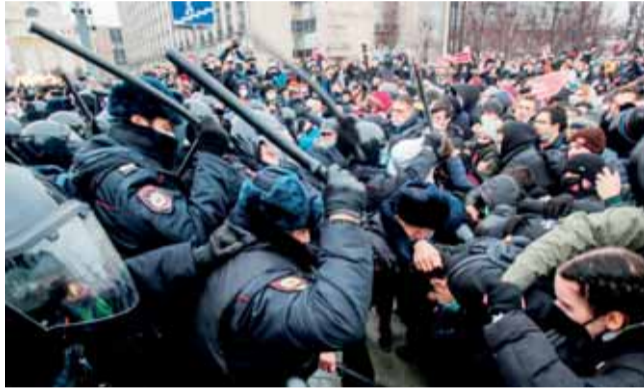
Oposição na Rússia tem sido reprimida

REPRESSÃO A ONU concluiu que a situação dos direitos humanos na Federação Russa «deteriorou-se significativamente» desde a invasão da Ucrânia, em fevereiro de 2022, com Moscovo a «amordçar a sociedade civil» e a «minar a independência do sistema judicial».