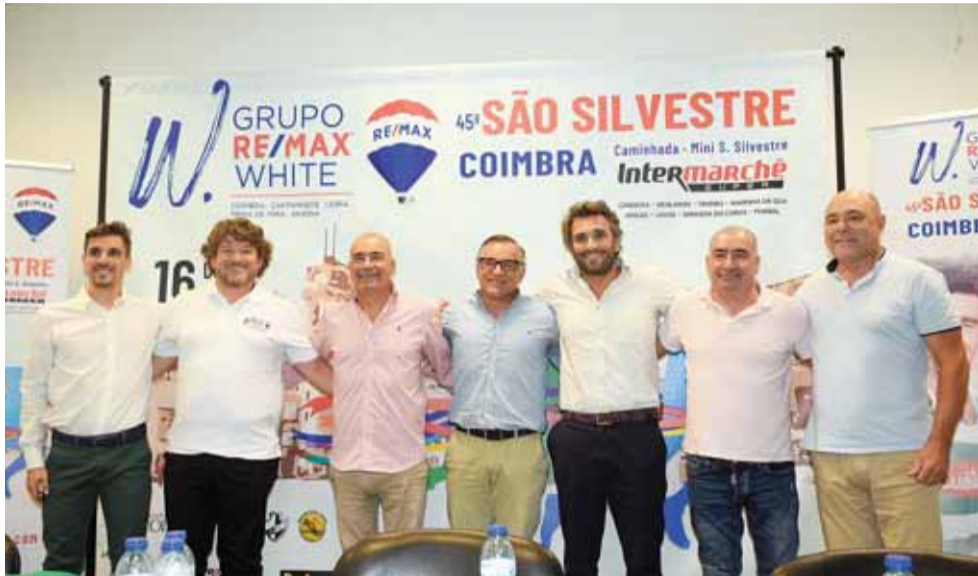
Gonçalo Gaspar, Nuno Marques, Domingos Castro, Luís Gaspar, Carlos Lopes, Dionísio Castro e David Soares