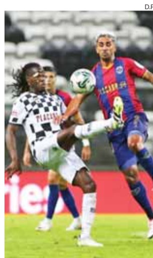
Boavista tem protagonizado um grande início de Liga

No domingo, os “xadrezados” têm um duro teste ao bom arranque em deslocação ao terreno do “europeu” Braga