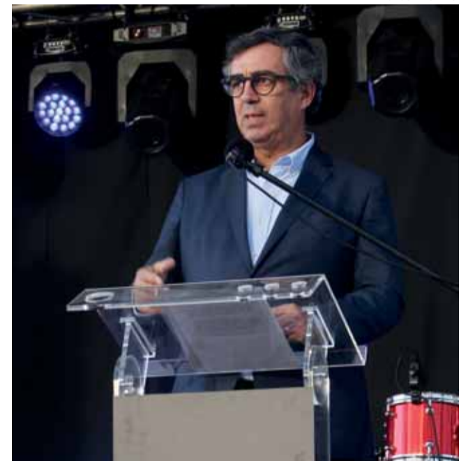
Jorge Conde deu as boas-vindas aos caloiros

Jorge Conde, presidente do Politécnico de Coimbra também marcou presença na sessão para dar as boas-vindas aos novos estudantes. «Todos os dias fazemos o melhor na perspetiva de construirmos um ensino superior melhor». «Aqui encontrarão um apoio constante», salientou o presidente, destacando o trabalho de docentes, psicólogos e não docentes de todas as instituições no apoio ao estudante.