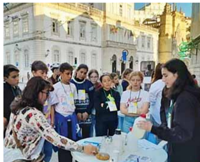
Dia 29 vai haver ciência nas principais artérias da Baixa, entre as 17h00 e a meia-noite

soas à Baixa e ao seu comércio. «O objetivo é, efetivamente, levar a Ciência para a Baixa», confirma a responsável, congratulando-se com o facto de o evento contar com o apoio da Câmara Municipal de Coimbra e da Agência para a Promoção da Baixa de Coimbra como parceiro e ter já confirmado o envolvimento de cerca de 60 lojistas que, durante o tempo em que decorre o evento, no dia 29, estarão de portas abertas para quem queira juntar a ciência à várias propostas comerciais que a Baixa tem para oferecer.