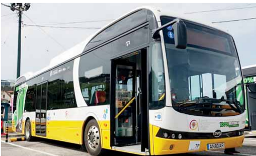
SMTUC vão ter 46 viaturas elétricas e não querem ficar dependentes de um só sistema de alimentação

Debate Processo de preparação de concessão pela Câmara de Coimbra recolheu contributos de operadores, que se manifestaram contra monopólio de postos