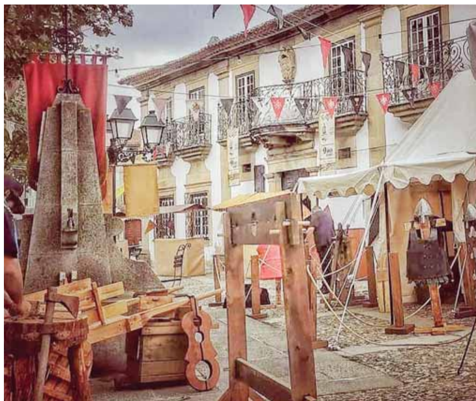
Auto de abertura do Mercado está marcado para as 11h00, seguindo-se o cortejo.

Um dos momentos altos do certame, será precisamente a recriação da entrega do Foral, agendado para as 16h00, em que «teremos a chegada de D. Egas Fafes, bispo de Coimbra, e a entrega e leitura do Foral», sublinha João Tavares, presidente da União de Freguesias. Regozijando-se com o número de mercadores inscritos, o autarca local aventou a possibilidade de, na próxima edição, o certame ser prolongado para «dois dias», tendo em conta a grande adesão. Além do aumento do número de mercadores presentes, o certame