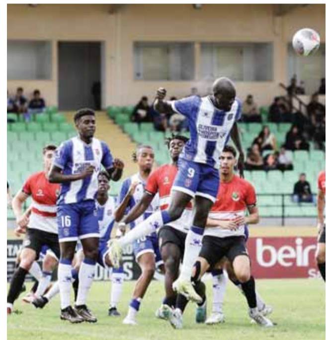
Daffé marcou diante de Fornos de Algodres e Pêro Pinheiro

O próximo compromisso dos oliveirenses, que não perdem há quatro duelos seguidos (entre “prova-rainha” e Liga 3), é precisamente o dérbi distrital no reduto da Briosa e o “9” referiu que o grupo está a «tra-