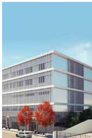
IPO com novo edifício

60 ANOS O ministro da Saúde, Manuel Pizarro estará segunda-feira à tarde em Coimbra para uma visita ao IPO de Coimbra. A sessão inicia-se às 15h00 no átrio do Edifício Ambulatório/Imagiologia e Administração e inclui o lançamento do carimbo comemorativo dos 60 anos de atividade do hospital que se comemoram este ano.