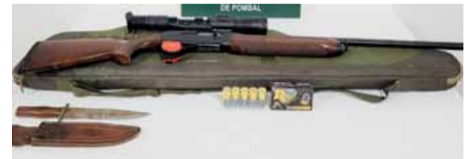
Armas apreendidas ao caçador furtivo

ANSIÃO A GNR deteve, em flagrante, um homem de 61 anos, no concelho de Ansião, por «caça com recurso a meios não permitidos. A detenção verificou-se no âmbito de uma ação de patrulhamento efetuada pelos militares do Núcleo de Proteção Ambiental de Pombal, que detetaram a presença do indivíduo a caçar, «sem que tivesse acesso legal à zona de caça» em questão e foro do período em que o ato venatório é