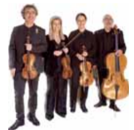
Quarteto de Cordas QCCcontemporâneo