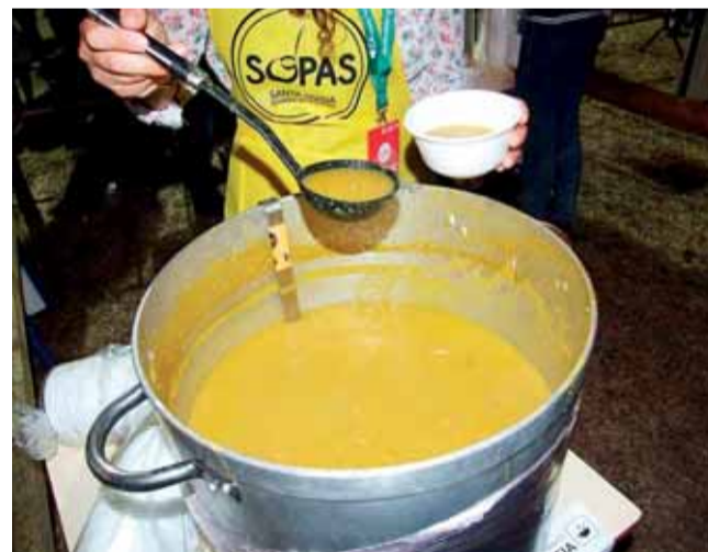
São 18 sopas que apresentam o ADN das cinco localidades