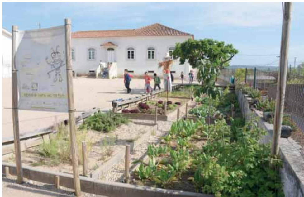
EB1 de Meãs do Campo vai ser alvo de requalificação