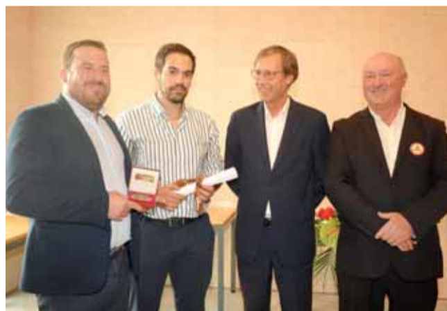
Pauliteiros de Vila Nova de Anços premiados no Dia do Município