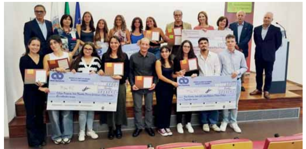
Prémios foram entregues ontem no edifício na Ordem dos Engenheiros do Centro

Prémio Iniciativa destina-se a instituições da Região Centro. O tema desta edição foi “Engenharia e o Mundo Digital”