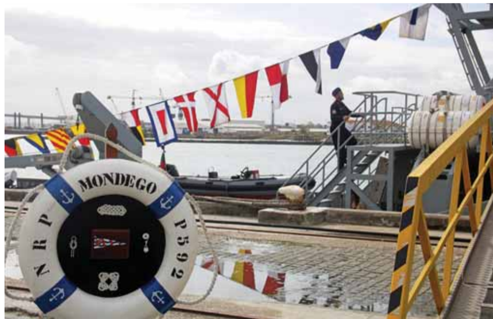
Navio da Marinha Portuguesa garante hoje ações de fiscalização, mas já foi um navio de combate

O NRP Mondego é o terceiro navio da classe Tejo (o NRP Tejo foi o primeiro dos quatro