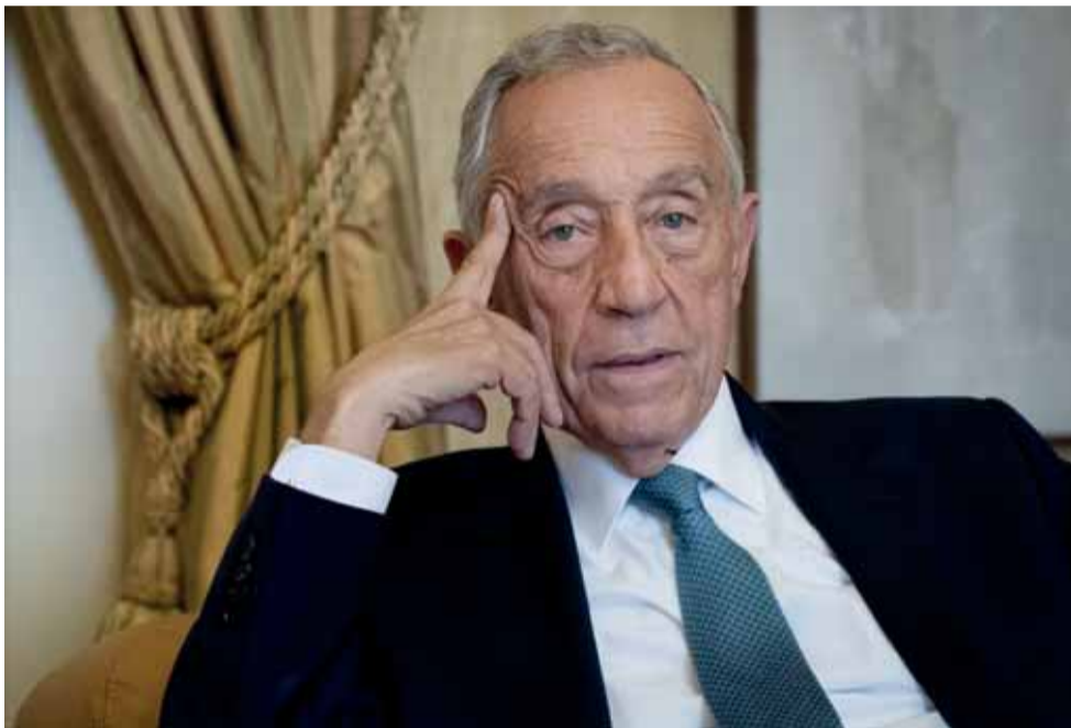
Marcelo Rebelo de Sousa falou sobre o possível privatização da TAP durante a sua visita aos EUA

Declarações Presidente da República não se opõe à privatização da TAP se a mesma for negociada como a “melhor solução” para os portugueses