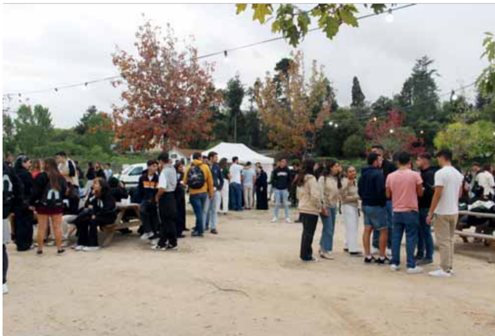
Alunos participaram em convívio direcionado para a integração dos novos estudantes

ticipar neste tipo de iniciativa é importante para «conhecer o pessoal do curso, mas também de outras escolas», afirmou Maria Vital.