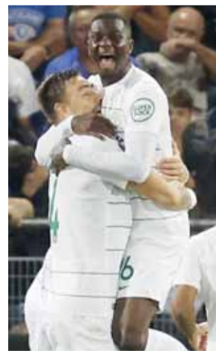
“Leões” viraram o resultado

Ainda na noite europeia de ontem, a Roma, liderada pelo técnico português José Mourinho, venceu no reduto do Sheriff (1-2). O “colosso” Liverpool começou com um triunfo na visita ao Lask Linz (1-3). ◀