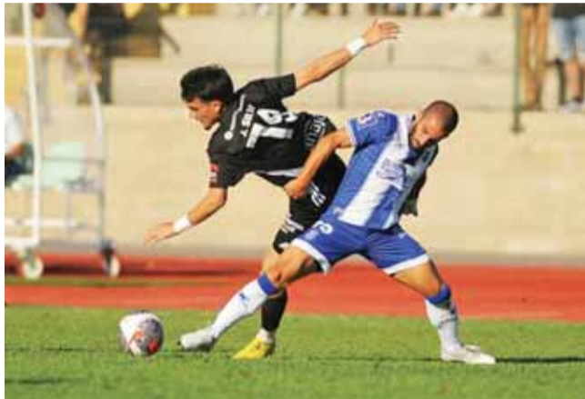
“Final” entre Académica e Ol. Hospital na 3.ª eliminatória

Este triunfo aconteceu na temporada transata, em partida da ronda 21 da Série B da Liga 3, por 1-0 no “local do crime”, leia-se Estádio Cidade de Coimbra, onde as duas equipas vão medir forças para a 2.ª elimi-