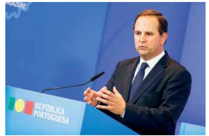
Fernando Medina apresentou ontem as medidas do Governo

A medida aprovada ontem em Conselho de Ministros e apresentada pelo ministro das Finanças, Fernando Medina, dirige-se a créditos de habitação própria e permanente, contraídos a taxa de juro variável ou