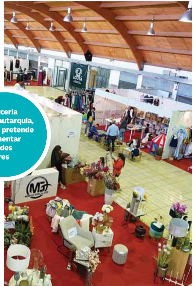
Lousã Outlet é uma das ações que promove o comércio local

Em parceria com a autarquia, a AESL pretende implementar atividades regulares